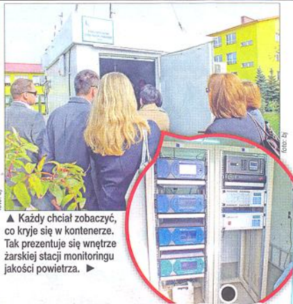
▲ Każdy chciał zobaczyć, co kryje się w kontenerze. Tak prezentuje się wnętrze żarskiej stacji monitoringu jakości powietrza. ►